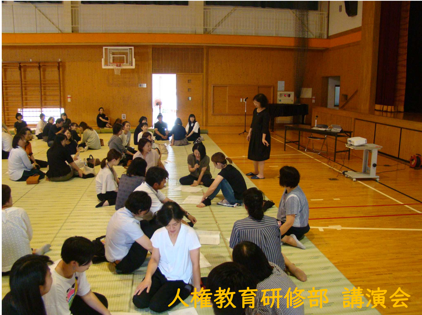
人権教育研修部 講演会